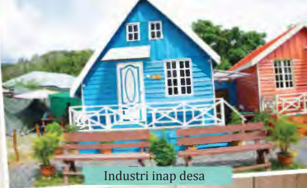
Industri inap desa