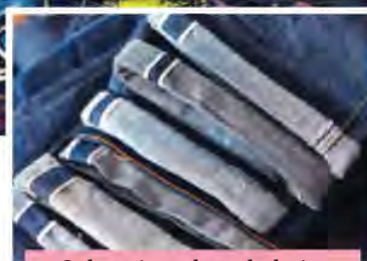
Seluar jeans kepala kain