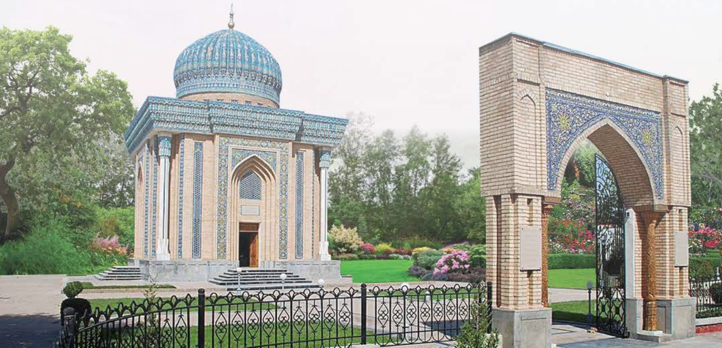
ضريح الإمام ماتوريدي، سمرقند